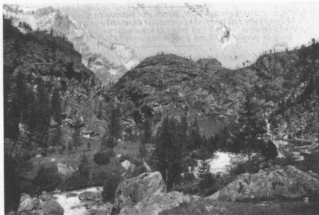
Piano di Pesontze sulla strada del Breuil (Cappella de N.-D. de la Garde)

In fondo al piano la strada con ripida salita raggiunge la cappella di N.-D. de la Garde o des Busserailles (*), eretta su d'un promontorio,