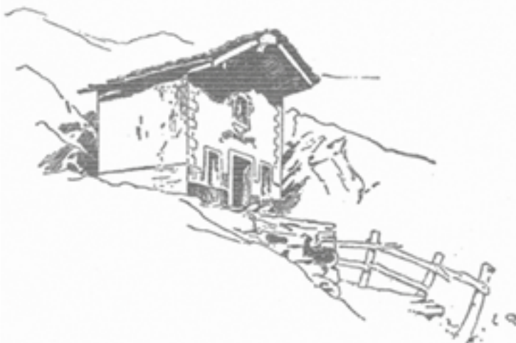
La chiesetta di Busserailles

non mai avvezzo ai terrori della vita primitiva, si ridesta ad una forma insolita di timore; ritrova una vaga traccia dell'istinto che gli è tramandato confusamente da' suoi antichissimi padri quando lottavano inermi contro le forze indomite della natura. E' come il brivido che scorre nelle vene del fanciullo che si trova solo nella grande foresta piena di strani rumori, è un senso arcano della potenza infinita dell'ignoto che circonda la vita, il « timor panicus » degli antichi.