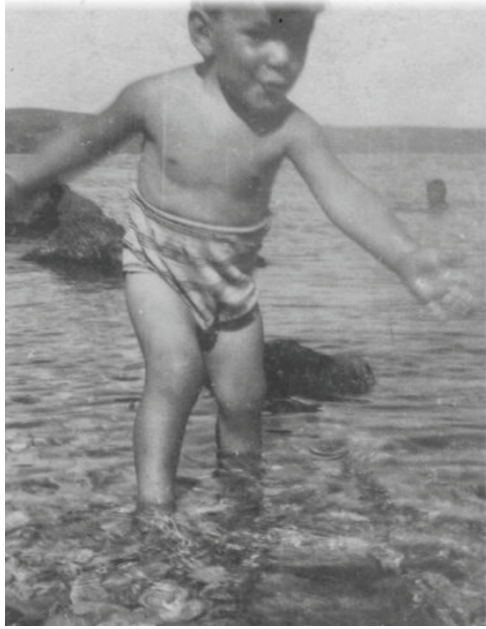
Lussino – Plinio al mare

Ho pochi ricordi. Abitavamo in una bella casa con giardino. Sopra i rami degli alberi, le zie mettevano il “vischio” per prendere gli uccelletti il che non mi piaceva. Facevo una vita non molto sorvegliata, spesso combinavo guai.