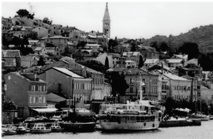
Lussinpiccolo. Osteria dietro al vaporetto