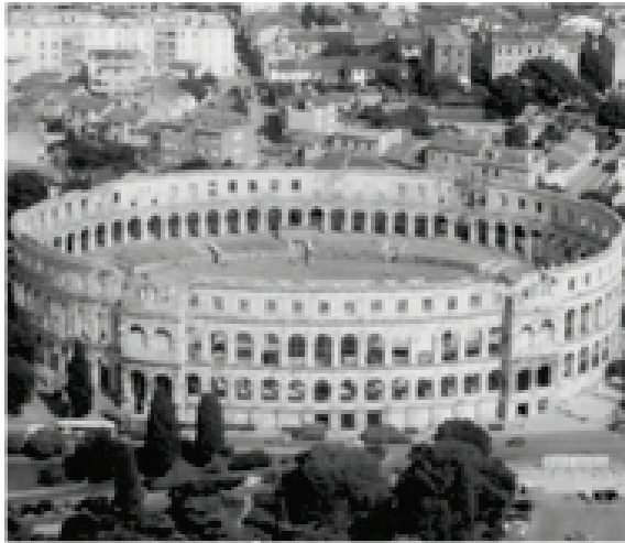
POLA, ARENA romana