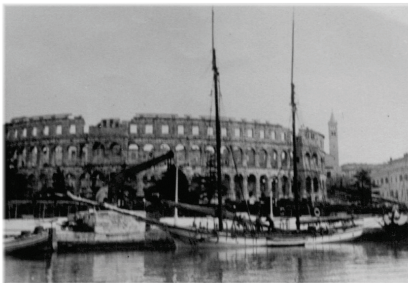
Pola anni 1930 – Una goletta nel porto. L'Arena sullo sfondo

Naturalmente, fatta una regolare denuncia, mi riconsegnarono al mittente.