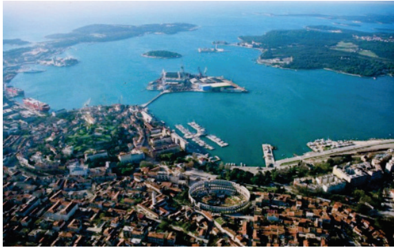
Pola, panorama (ISTRIA – ora CROAZIA)